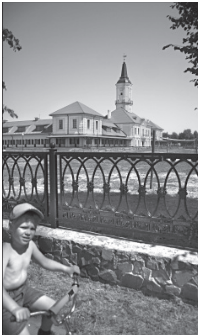
Шклоўская ратуша – адзіная, што захавалася ў першасным выглядзе.