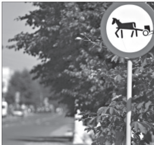
Уезд коньмі ў цэнтар Шклова дыскрэдытуе РБ.