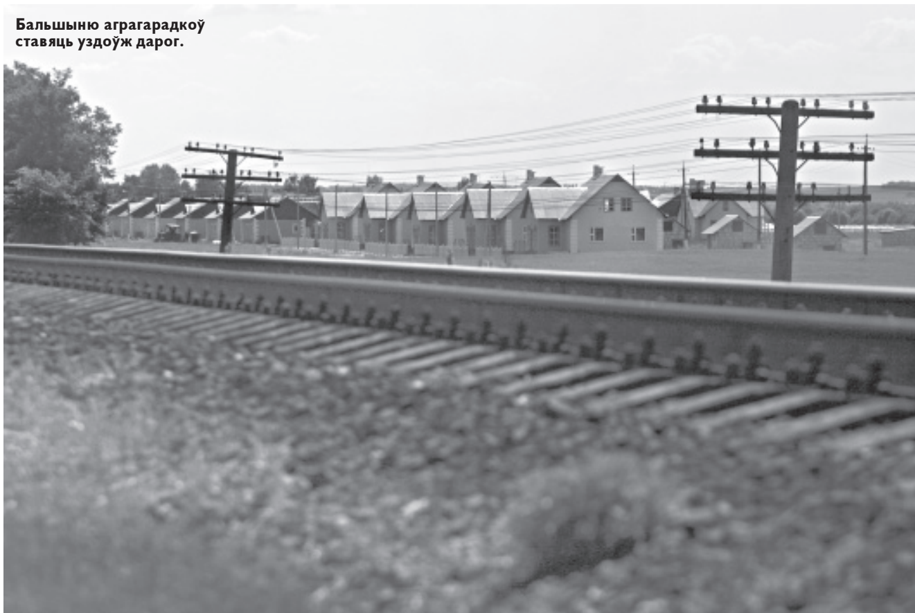
Большыню аграгарадкоў ставяць уздоўж дарог.