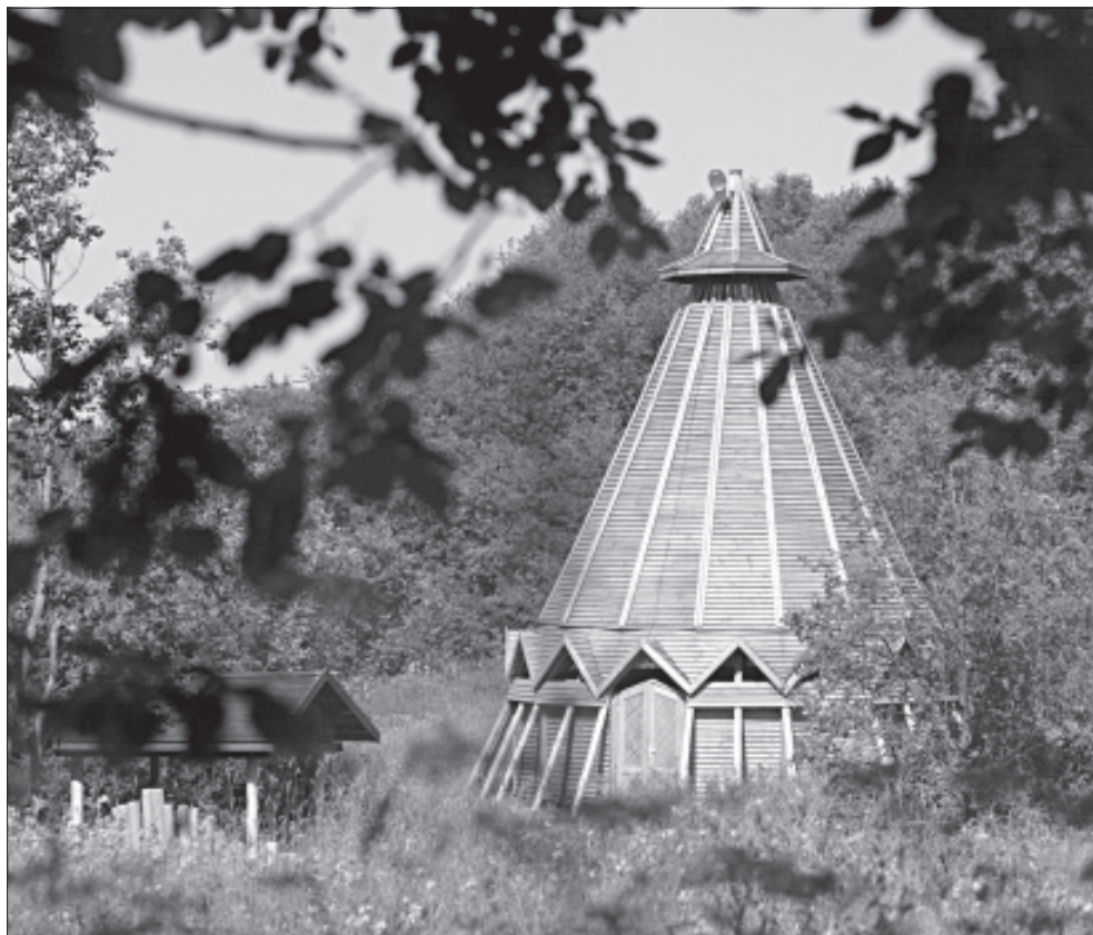
Вігвам над крыніцай прэзыдэнцтва.

Зьяжджалі з Александрыі-2 з адчуваньнем лёгкай крыўды за... Быкава. У пісьменьніка ж ніхто не папытаўся, і на яго радзіме ў Бычках цяпер стаіць не густоўная альтанка, у якой добра думаецца пад пошум дрэваў, а новая лякіраваная па-