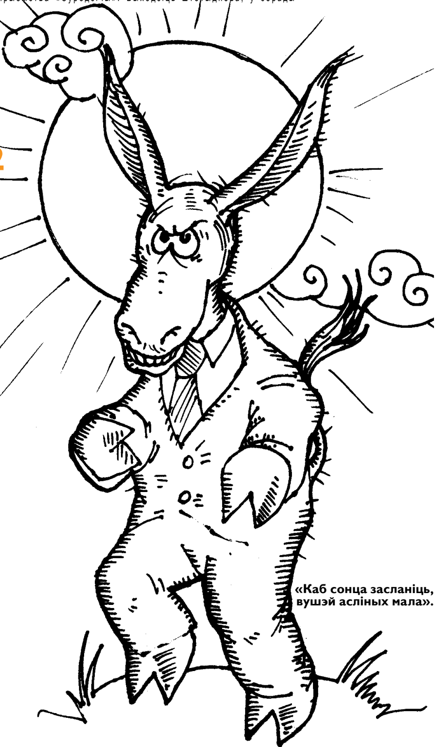
«Каб сонца заслانیць, вушэй асліных мала.»

• «Сайт будзе працаваць да апошняга кліента». «НН» звязалася з таямнічым «Пецем», стваральнікам сайта prokopovi.ch. Старонка 8.