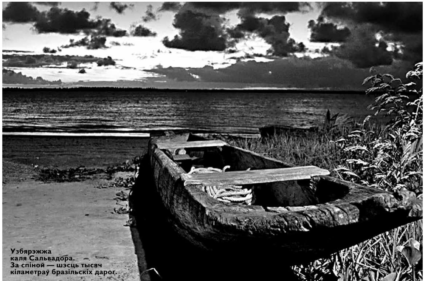
Узбрэжжа каля Сальвадора. За спіной — шэсць тысяч кіламетраў бразільскіх дарог.