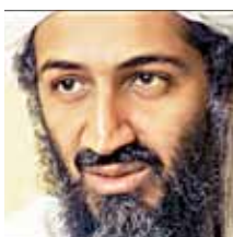
Асама бен Ладэн