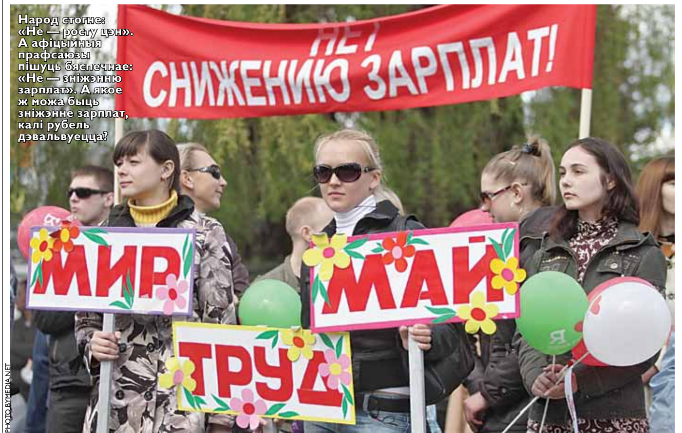
Народ стогне: «Не — росту цен». А афіцыйныя прафсаюзы пішуць бяспечнае: «Не — зніжэнню зарплат». А якое ж можа быць зніжэнне зарплат, калі рубель дэвальвуйца?