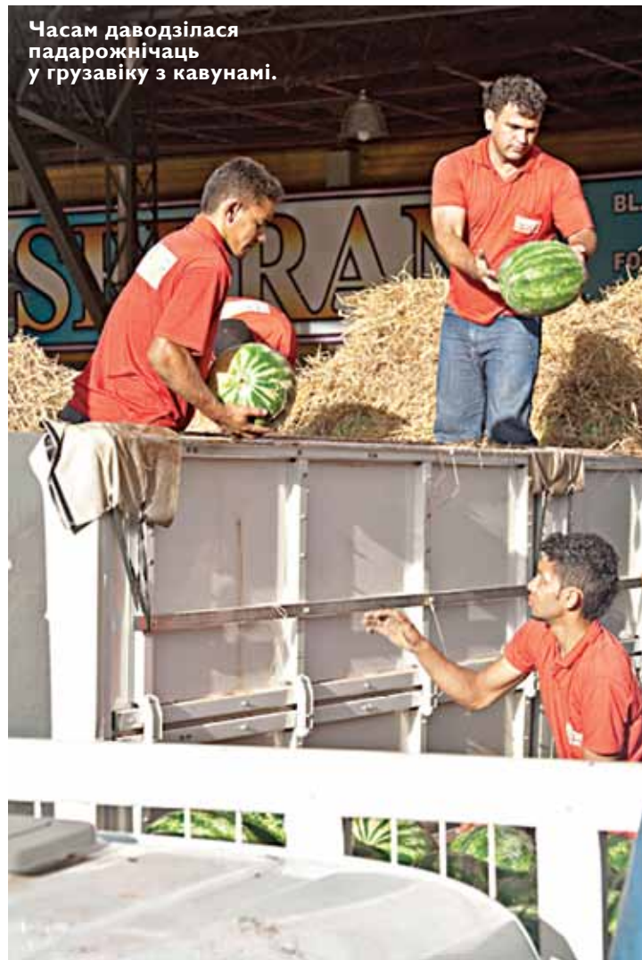
Часам даводзілася падарожнічаць у грузавіку з кавунамі.