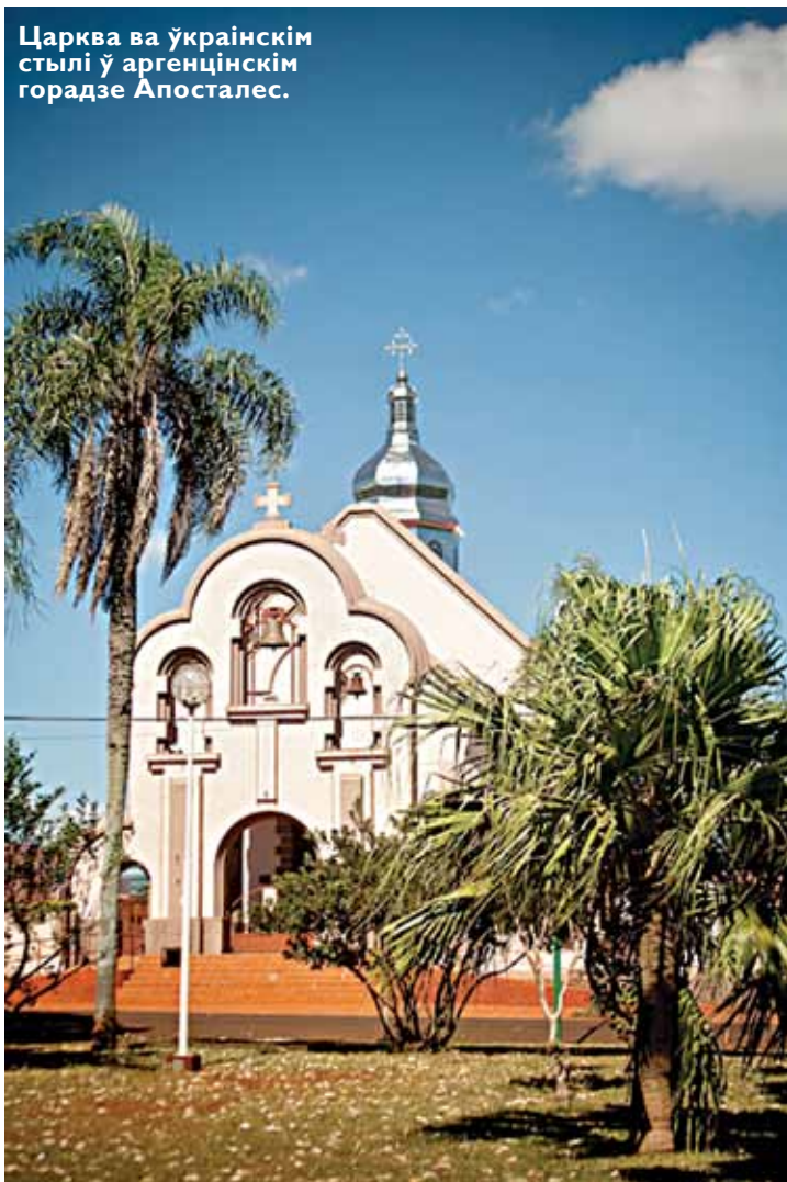
Царква ва ўкраінскім стылі ў аргенцінскім горадзе Апосталес.