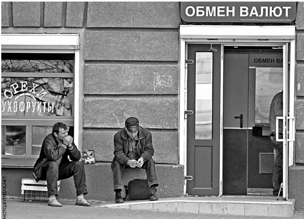
У чаканні даляраў.

Белстат: 600 тысяч работнікаў спынілі сваю дзейнасць.