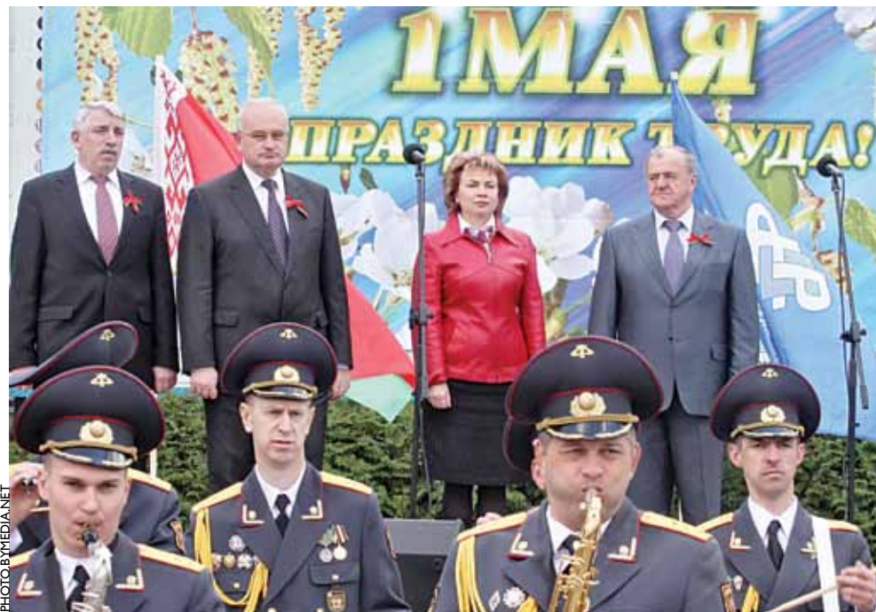
Справа налева — старшыня Федэрацыі прафсаюзаў Беларусі Леанід Козік, міністр працы Марыяна Шчоткіна, старшыня Мінгарвыканкама Мікалай Ладуцька на першамайскім мітынгу.