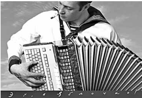
Працы Уладзіміра Цэслера.